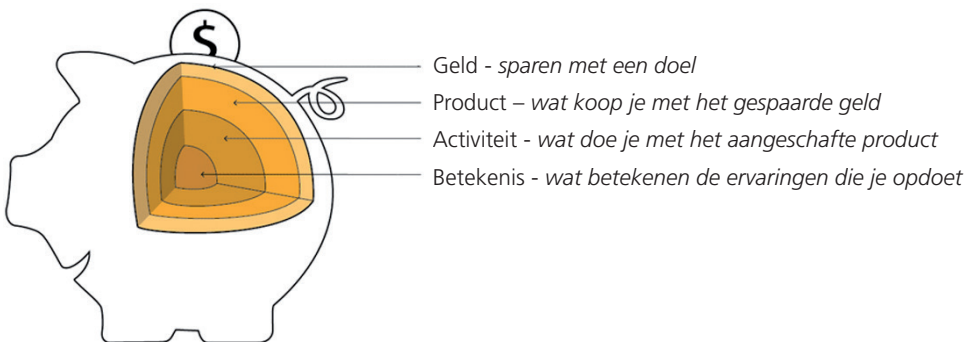
Figuur 1. Sparen als een bron van geluk

Santiago had zich als doel gesteld een vorm van digitaal sparen te ontwerpen die kan bijdragen aan het geluk van de spaarder door het sparen weer tastbaar te maken. In zijn onderzoek kwam hij tot drie kerninzichten. Stel, je spaart voor een nieuw paar hardloepschoenen. Het eerste inzicht was dat het sparen betekenisvoller wordt als tijdens het sparen de relatie met het spaardoel ervaarbaar wordt gemaakt: de hardloepschoenen. Het tweede inzicht was dat het 'ding op zich' de spaarder niet gelukkig maakt, maar de activiteiten die iemand gaat