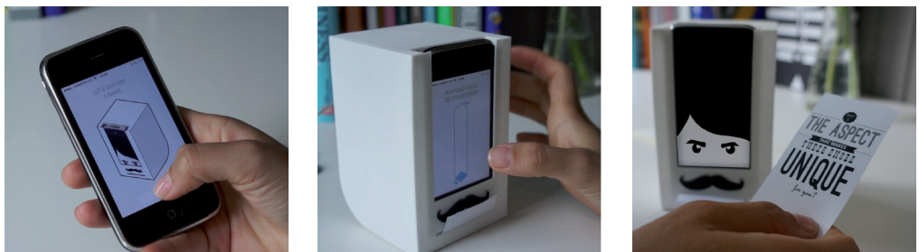
Figuur 3. Met prikkelende vragen stimuleert Billy Cash de diepere betekenis te ontdekken van het spaardoel