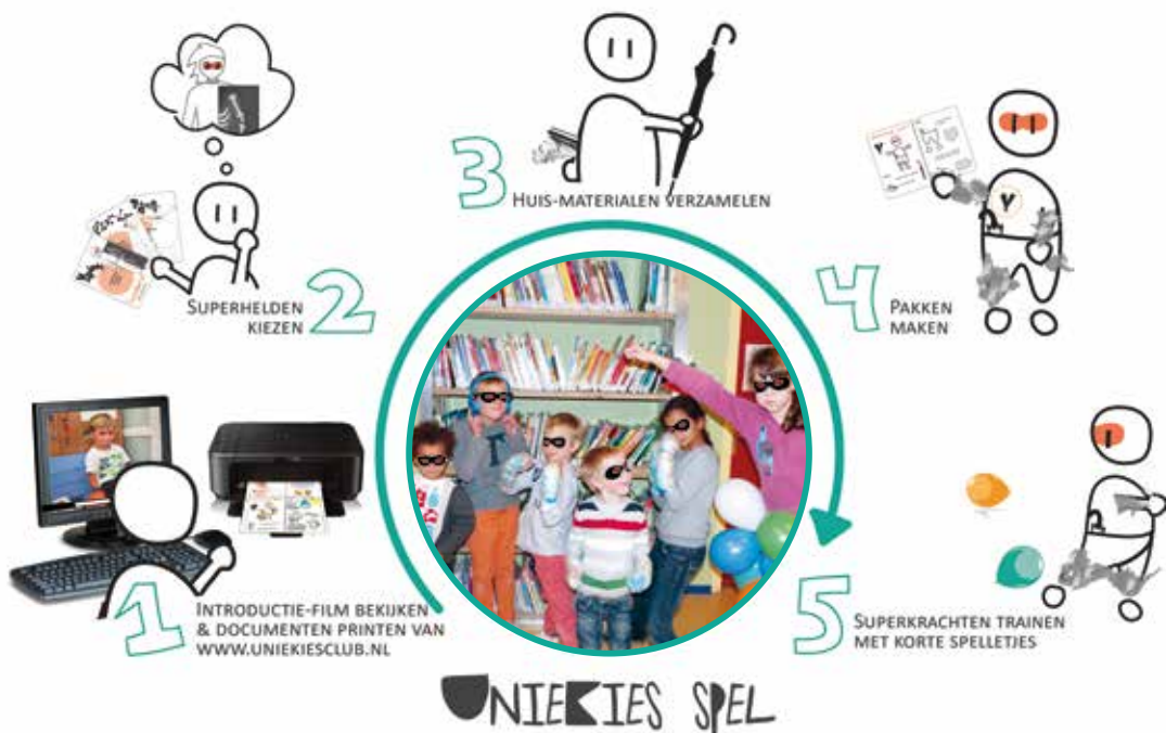
Figuur 2. Vijf stappen in het spelen van Uniekies

bedenken de kinderen samen spelletjes waarin ze hun super-krachten kunnen laten gelden.