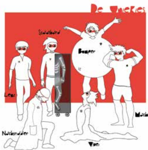
Figuur 1. Zes Uniekies Superhelden

door een heleboel ballonnen met touwtjes aan je lichaam te binden. Met dat pak kan je 'bumperen' net als superheld Bumper. En tegelijkertijd ervaar je op een speelse manier de uitdagingen van het voortbewegen met een rolstoel. Als alle superhelden zijn aangekleed,