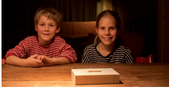
1. Klaar voor de start