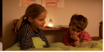
6. Een kleurig, geurend nachtlampje

het kaartje in het nachtlampje om dat naast hun bed te zetten. Hoe vaker de Snuffel-Knuffel wordt gebruikt, hoe sterker de associatie wordt tussen de geur en de ontspannen stemming.