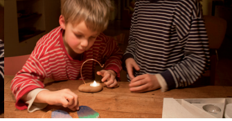
5. Lampje samenstellen