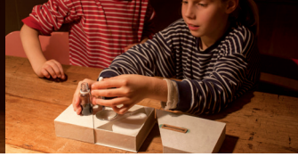
2. Een kneepje geur