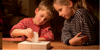
3. Kaartje plaatsen